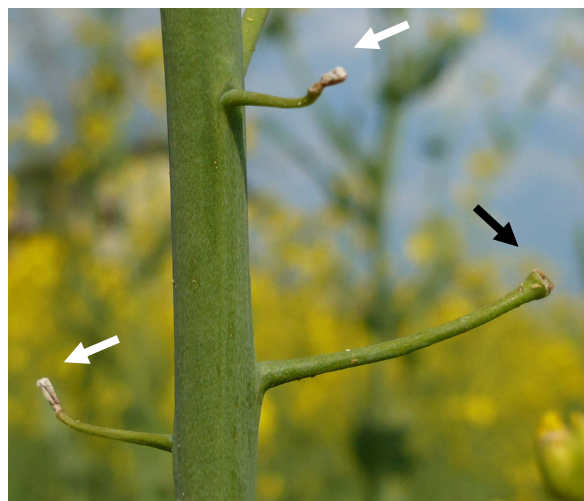
S'il s'agit de flétrissement des bourgeons (flèche blanche) ce sont les bourgeons et les tiges qui sèchent, tandis que s'il s'agit de dégâts du méligèthe du colza (flèche noire), des tiges fortes munies de faibles ébauches de siliques cessent de croître.

1,5 - 4 mm de long, de couleur jaune-blanc, avec 2 à 3 taches brunes sur chaque segment du corps, tête et pattes brun-noir.