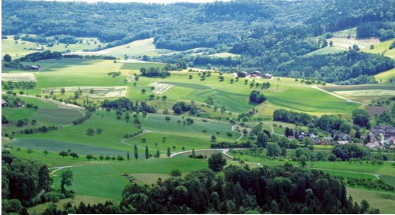
Vielfältige Landschaften haben einen hohen Erholungswert.