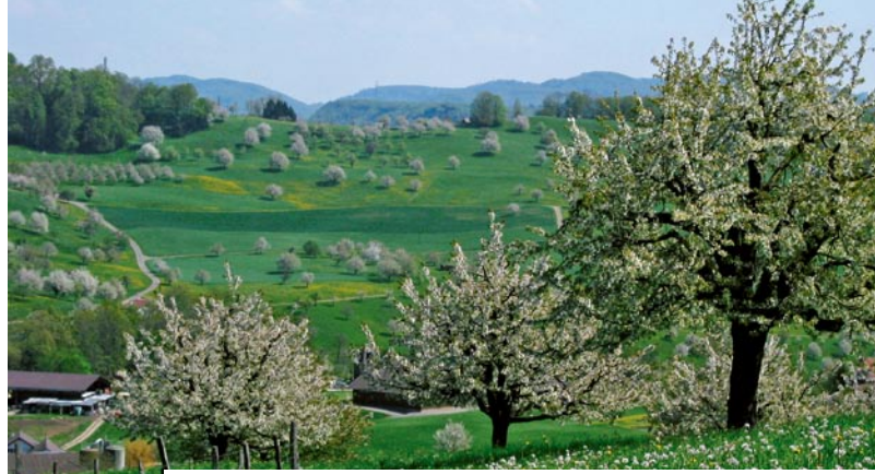
Hochstammobstbäume sind zahlreicher auf Schweizer Biobetrieben.

Diese Faktoren fördern nicht nur die Biodiversität, sondern stärken auch die natürlichen Kreisläufe und steigern so die Nachhaltigkeit von Biobetrieben [2,16,18].