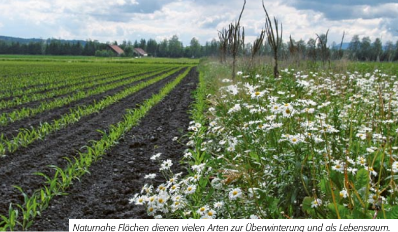
Naturnahe Flächen dienen vielen Arten zur Überwinterung und als Lebensraum.