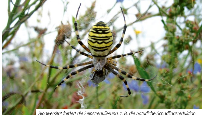
Biodiversität fördert die Selbstregulierung, z. B. die natürliche Schädlingsreduktion.

Vergleiche von Biobetrieben mit konventionellen Betrieben in der Schweiz [19] und in England [6] zeigen, dass der Anteil an naturnahen Flächen auf Biobetrieben höher ist als auf konventionellen Betrieben. Eine Analyse sämtlicher Schweizer Landwirtschaftsbetriebe ergab, dass die Biobetriebe im Durchschnitt 22 % und die Nicht-Biobetriebe 13 % ihrer Nutzfläche als naturnahe Fläche ausscheiden. Biobetriebe setzen damit 2/3 mehr Massnahmen um (Abb. 2). Die grössten Unterschiede wurden bei extensiv und wenig intensiv genutzten Wiesen sowie Hecken und Hochstammobstbäumen in der Tal- und Hügellzone festgestellt [19].