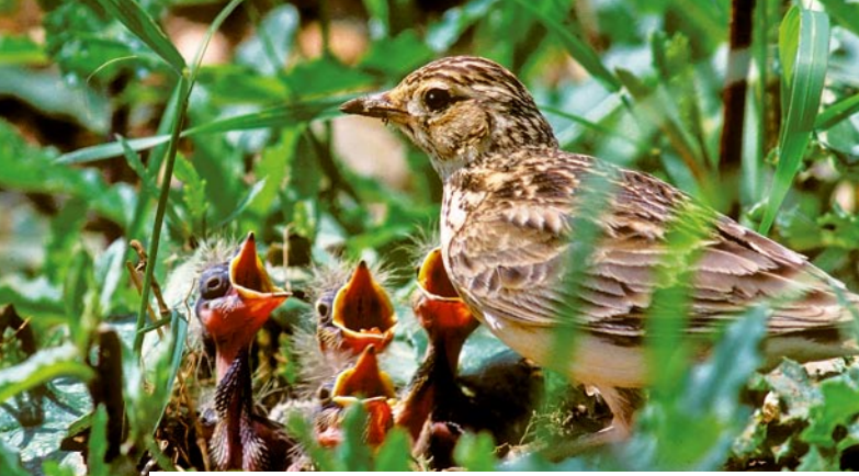
Bodenbrüter können nur in wenig intensiven Flächen überleben (Feldlerche).