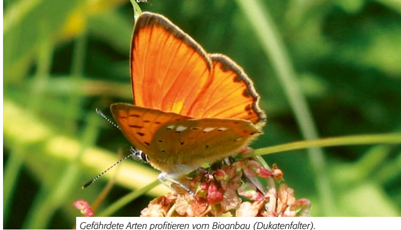
Gefährdete Arten profitieren vom Bioanbau (Dukatenfalter).